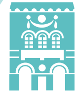
Mairie de Saint-Rémy-de-Provence