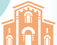
Église de Saint-Martin-de-Crau