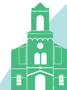
Église de Boulbon