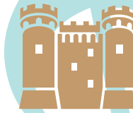
Château de Tarascon