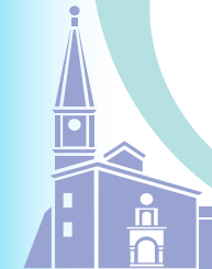
Église de Saint-Pierre-de-Mézargues