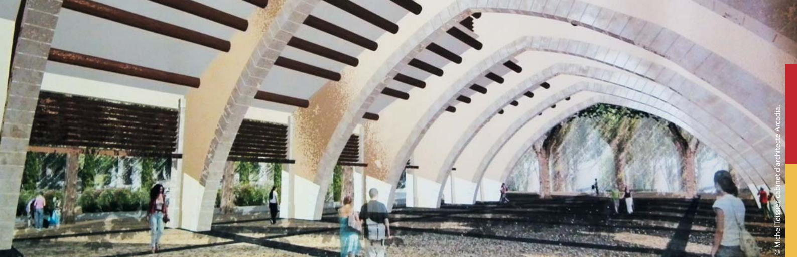
© Michel Teisser, cabinet d'architecte Arcadia.