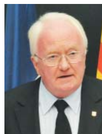
Michel Vauzelle Président de la Région Provence-Alpes-Côte d'Azur

« La communauté d'agglomération Arles Crau Camargue Montagnette bénéficie, depuis sa création en 2004, d'un soutien sans faille de la Région.